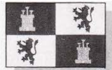
CASTILLA Y LEÓN